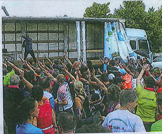
Il régnait une joyeuse ambiance ce jeudi matin à Awoingt !