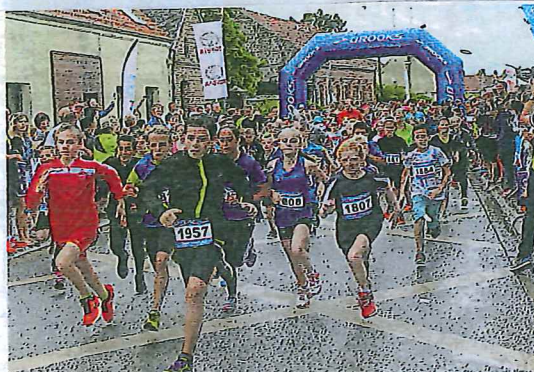
Le départ des enfants...