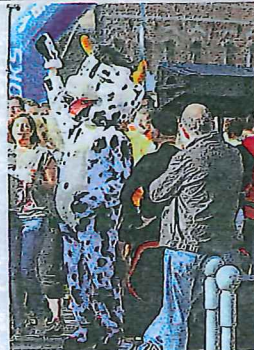
Awoingt est connu pour sa laiterie et ses Foulées.