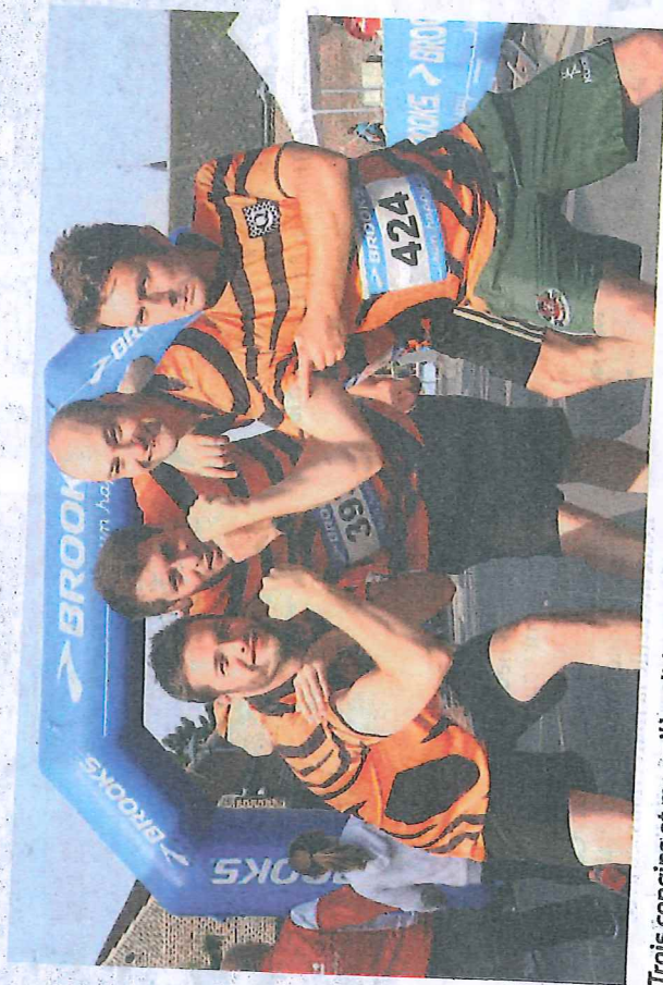
Trois copains et me voilà solidement armé pour les foulées d'Awoingt.

L'organisation souhaitait faire de ce 20 e anniversaire une édition exceptionnelle. 1200 coureurs étaient au rendez-vous de ces Foulées.